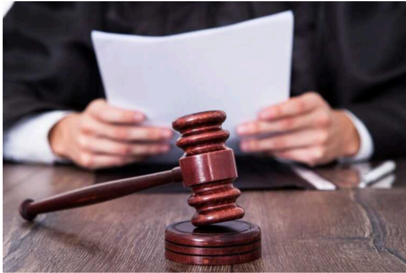
Троє суддів Печерського райсуду виявились дисертантками Олега Татарова

Журналісти виявили, що троє суддів Печерського районного суду Києва, які вели гучні справи, були дисертантками скандального ексочільника Офісу президента Олега Татарова. Зокрема, вони ухвалювали рішення про справи екснамісника Києво-Печерської лаври Павла Лебеда та домашній арешт для активіста Романа Ратушного.