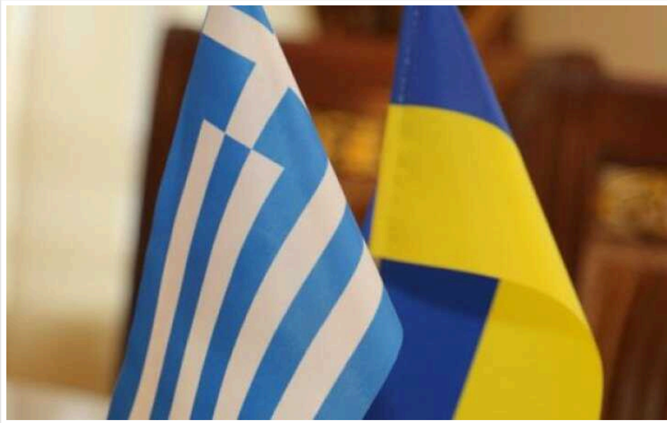
Греція та Україна розпочали підготовку угоди щодо гарантій безпеки

Україна та Греція розпочали підготовку двосторонньої угоди щодо безпекових гарантій і нашої співпраці.