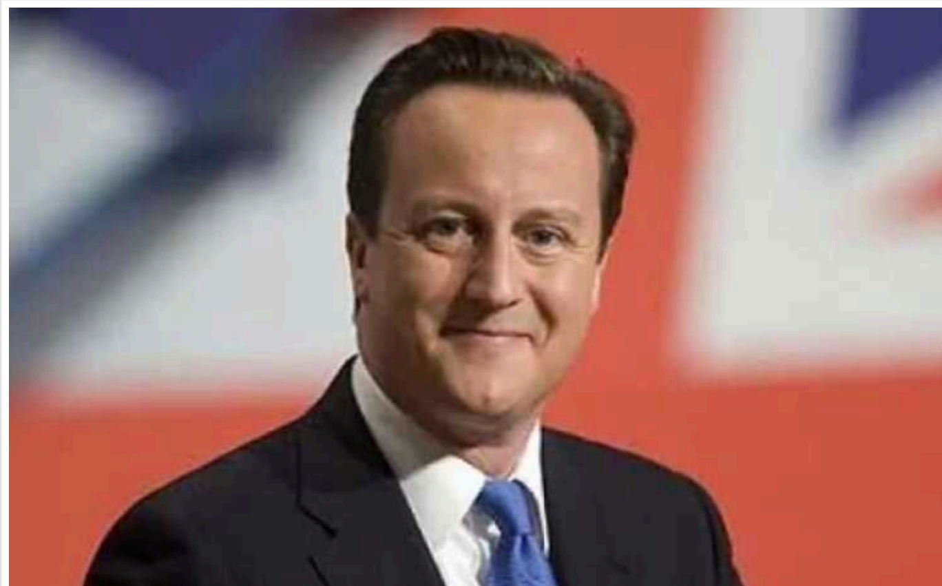
Велика Британія готова запозичити Україні всі заморожені російські активи, – Кемерон

Глава британського МЗС окреслив алгоритм пропозиції щодо використання заморожених російських активів, зазначивши, що ті можуть використовуватися як гарантія виплати репарацій.