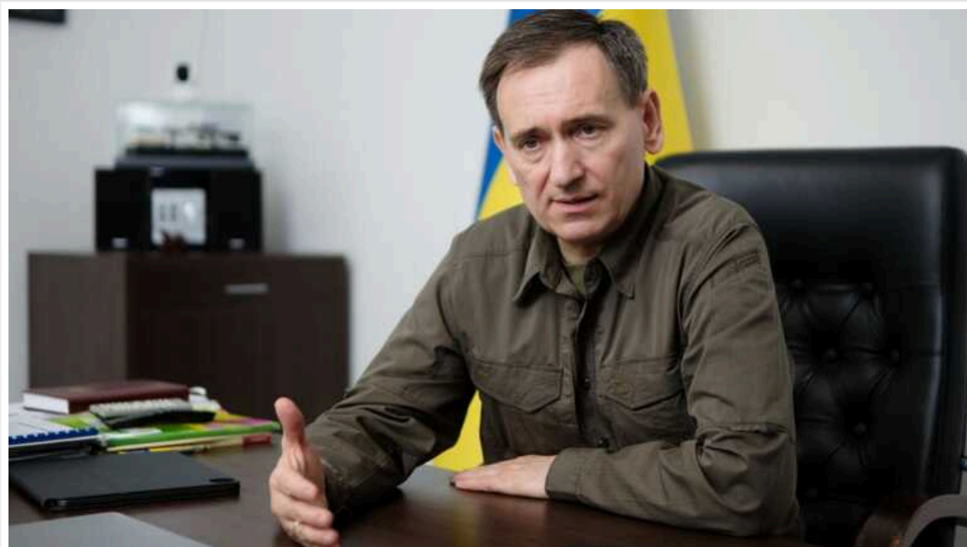
"Ми допускаємо лише одне обмеження – право керування транспортними засобами", - Веніславський про закон про мобілізацію

Члени комітету Верховної ради з питань нацбезпеки, оборони та розвідки наразі допускають лише одне обмеження військовозобов'язаних громадян у законопроекті про мобілізацію. Йдеться про право керування транспортними засобами.