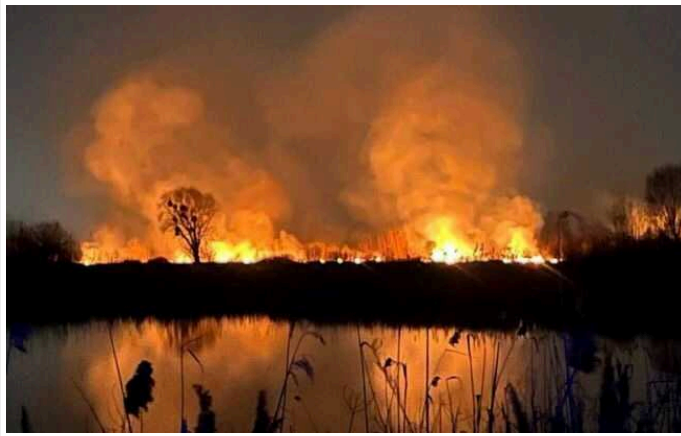
Поліція Києва відкрила кримінальне провадження щодо пожежі на Осокорках

Поліція Києва відкрила кримінальне провадження за фактом пожежі на території ландшафтного заказника "Осокорківські луки".