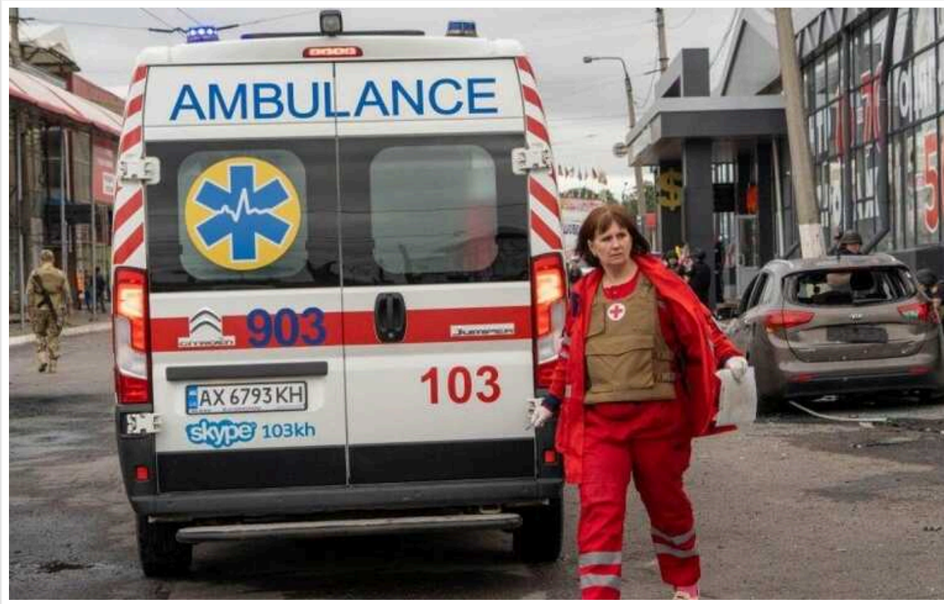
Окупанти вдарили по Боровій на Харківщині: є загиблий, поранені діти

За інформацією голови ОВА Олега Синегубова, внаслідок обстрілів виникла пожежа на території домоволодіння, знищені автомобіль, гараж, господарчі споруди.