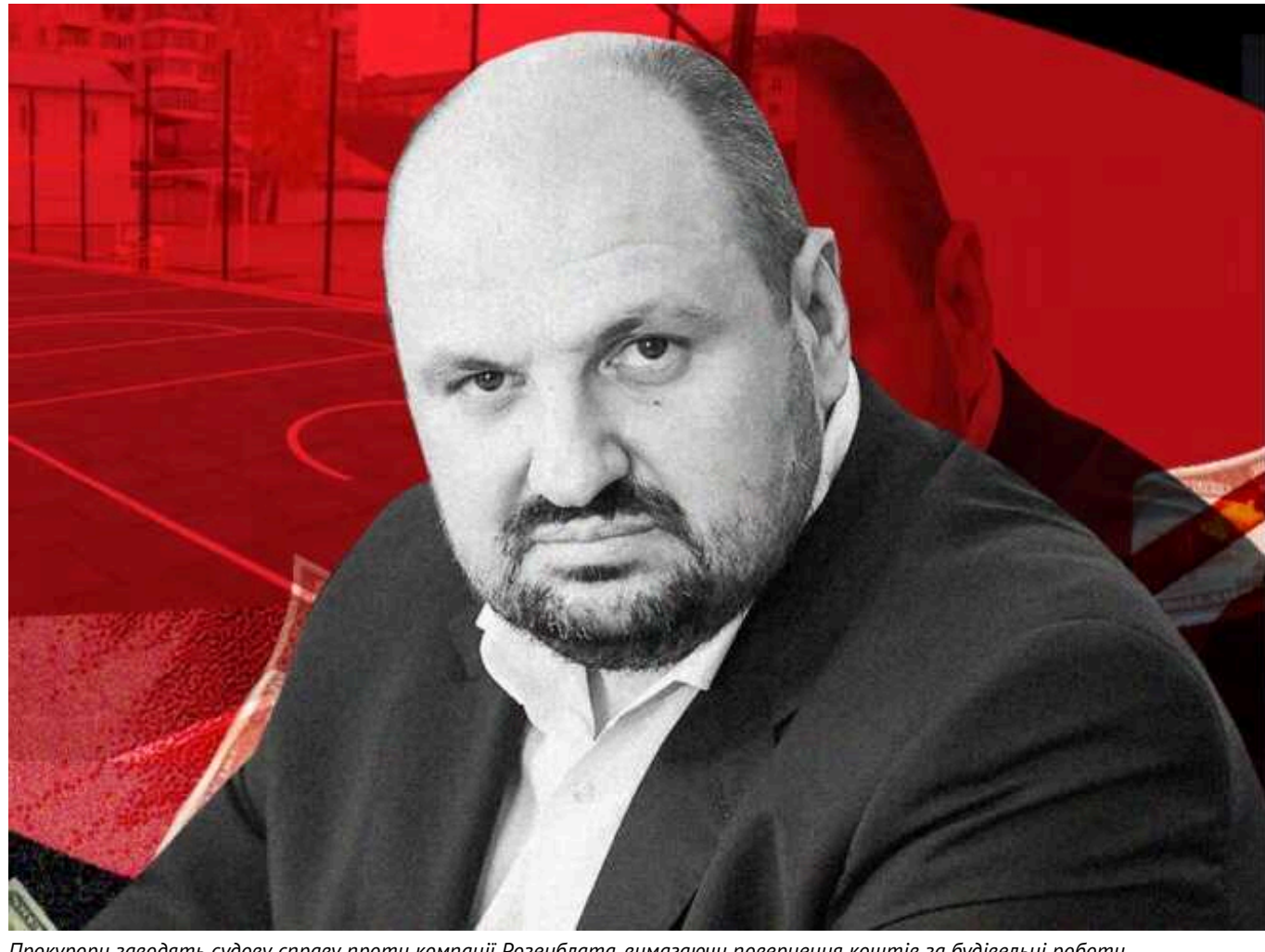
Прокурори заводять судову справу проти компанії Розенблата, вимагаючи повернення коштів за будівельні роботи

Житомирська окружна прокуратура судиться з компанією «Фаворит ОПТ», яка належить екснардепу Бориславу Розенблату. Прокурори вимагають визнати недійсним укладений договір між «Фаворит ОПТ» та Управлінням капітального будівництва Житомирської міської ради та стягнути з компанії 1,66 млн грн – це весь прибуток, який вона отримала під час реконструкції спортивного майданчика у місті.