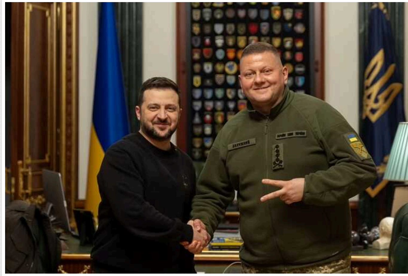
У другому турі президентських виборів Зеленський без шансів програв би Залужному: 67% на 32% голосів – опитування

Якби вибори до Верховної Ради відбулися цього року, то понад третина українців підтримали б політичну силу Валерія Залужного.