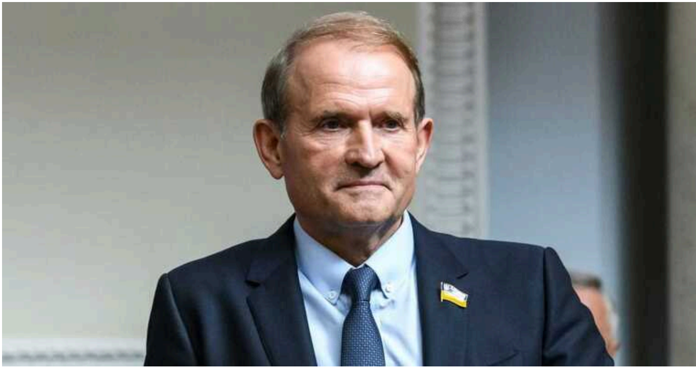
Держзрадник Віктор Медведчук намагається повернути громадянство та депутатський мандат через суд

Колишній депутат ОПЗЖ, якого підозрюють у державній зраді, також хоче домогтися скасування санкцій проти нього.