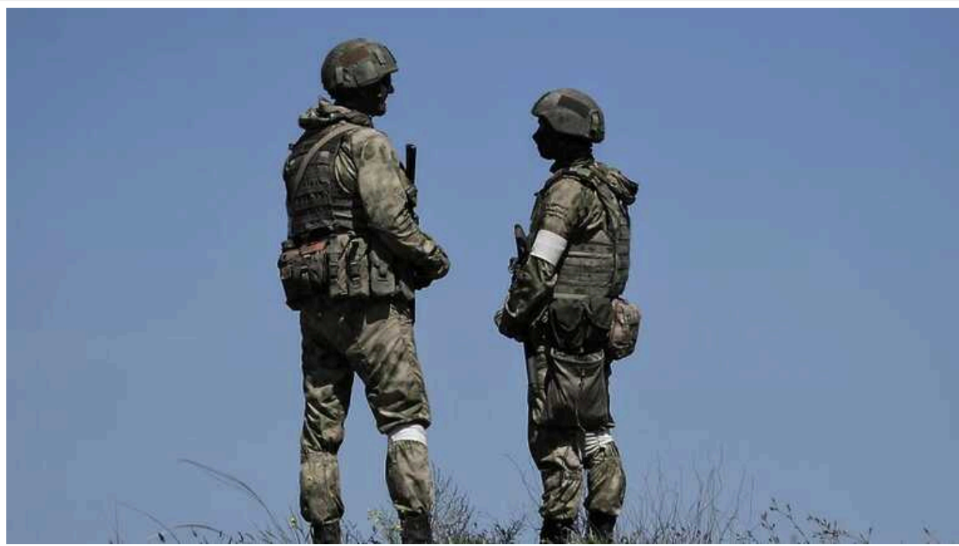
Громадяни Індії заявили, що їх змушують воювати в Україні

У Мережі з'явилася відеозвернення сімох громадян Індії, в якому вони заявили, що їх змушують воювати в Україні на боці Росії.