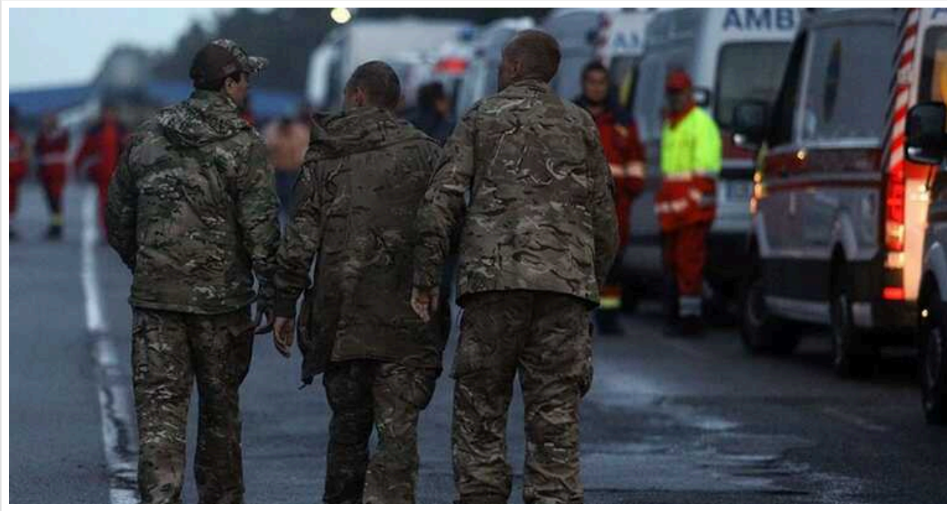
Росіяни торгують українськими полоненими на «чорному ринку», – ISW

Російські військові продають українських військовополонених на "чорному ринку" чеченським воєнізованим угрупованням, які надалі проводять власні обміни полоненими з Україною.