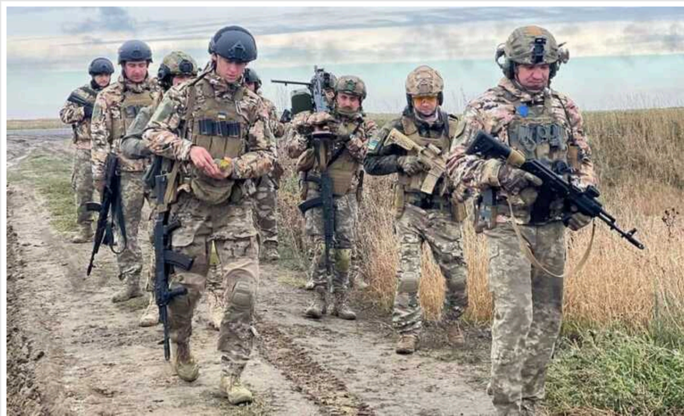
Ситуація на фронті: ЗСУ дали відсіч ворогу на Авдіївському напрямку і утримують плацдарм на лівобережжі Херсонщини

На Авдіївському напрямку наші оборонці відбили 23 атаки противника. Російські окупаційні війська також не припиняють спроб наступу на Херсонському напрямку, але Сили оборони продовжують утримувати свої позиції.