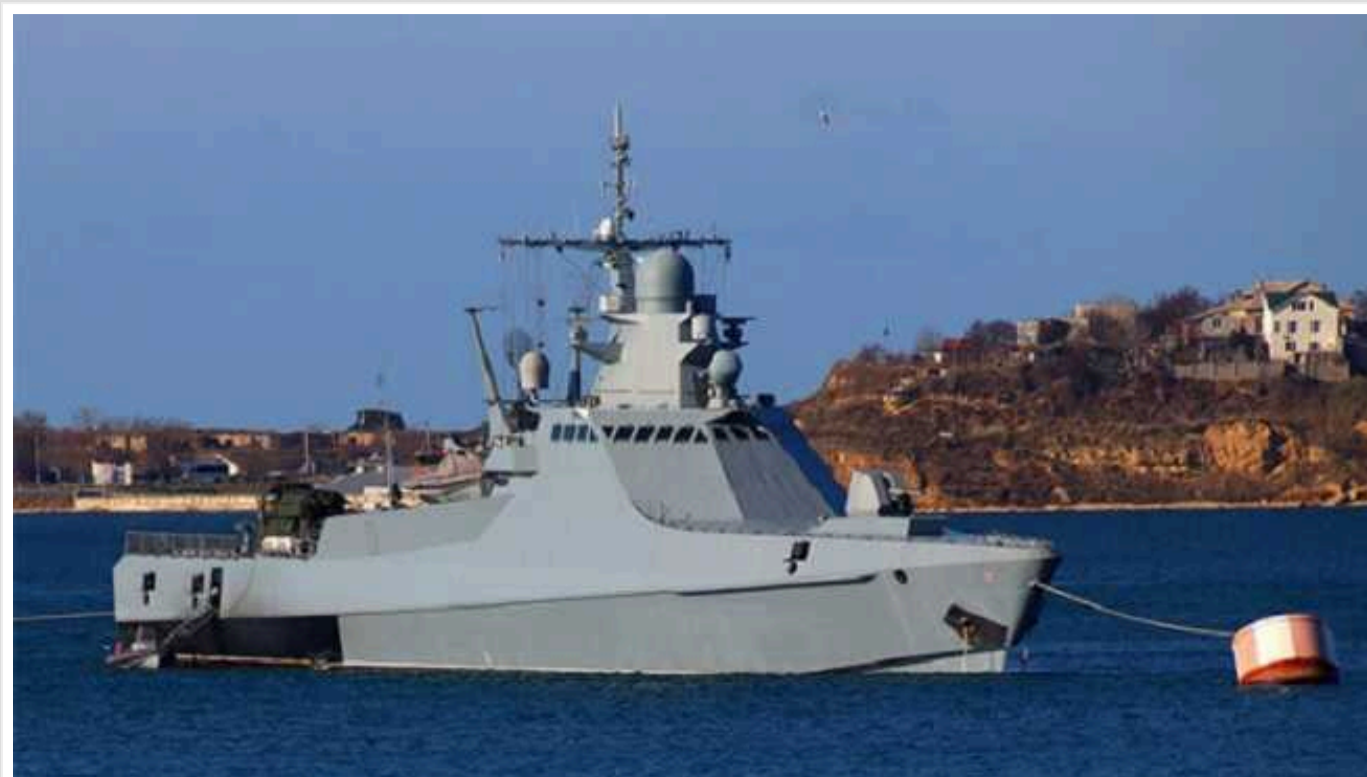
В ISW розповіли про настрої російських Z-блогерів: втрата корабля «Сергій Котов» підняла хвилю обурення в РФ

Знищення морськими дронами Головного управління розвідки Міністерства оборони України російського патрульного корабля "Сергій Котов" спровокувало хвилю обурення у спільноті російських Z-блогерів. Так званих "військорів" та численних пропагандистів вивела з себе відсутність будь-якої реакції на чергову втрату Чорноморського флоту РФ з боку російського командування.