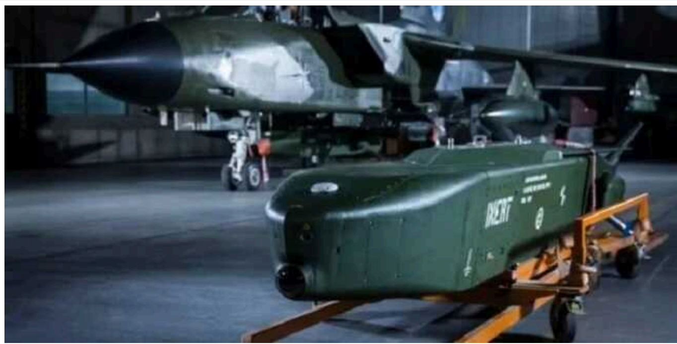
Більшість німців, як і раніше, не підтримують постачання Україні ракет Taurus

Більшість німців солідарні з канцлером Шольцем і, як і раніше, не підтримують постачання Україні ракет Taurus.