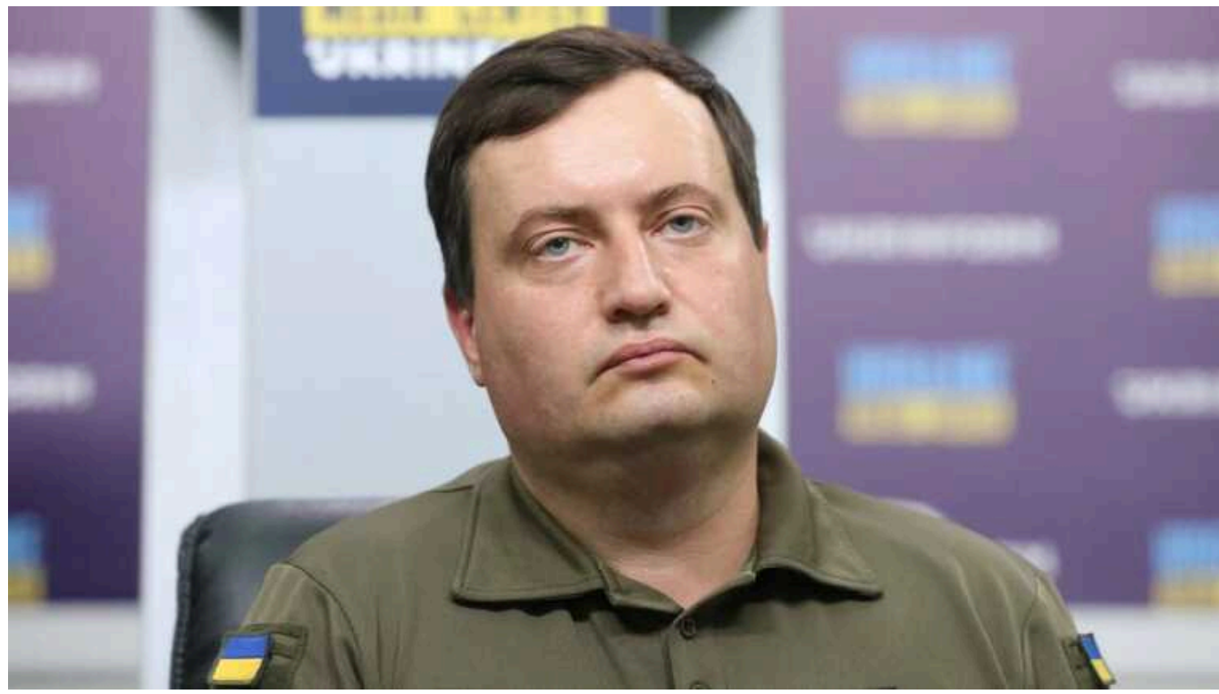
У Гур висловилися про «злив» розмови офіцерів бундесверу: «Погрожують усьому світу»

В українській розвідці наголосили, що загроза з боку РФ має "глобальний характер". Представник відомства Андрій Юсов розповів, якою має бути реакція світу на небезпечну ІПСО.