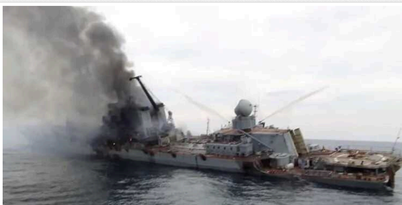
OSINT-аналітики назвали кількість знищених кораблів РФ

Втрати великих десантних кораблів і фрегатів знижують здатність агресора до проведення широкомасштабних морських операцій, що має довгострокові стратегічні наслідки для флоту РФ.