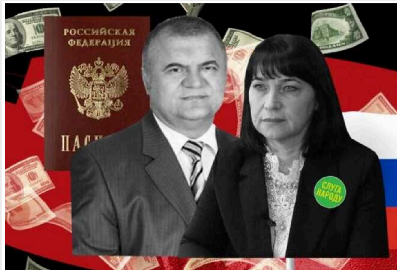
Депутатка облради з Запоріжжя зареєструвала бізнес у РФ