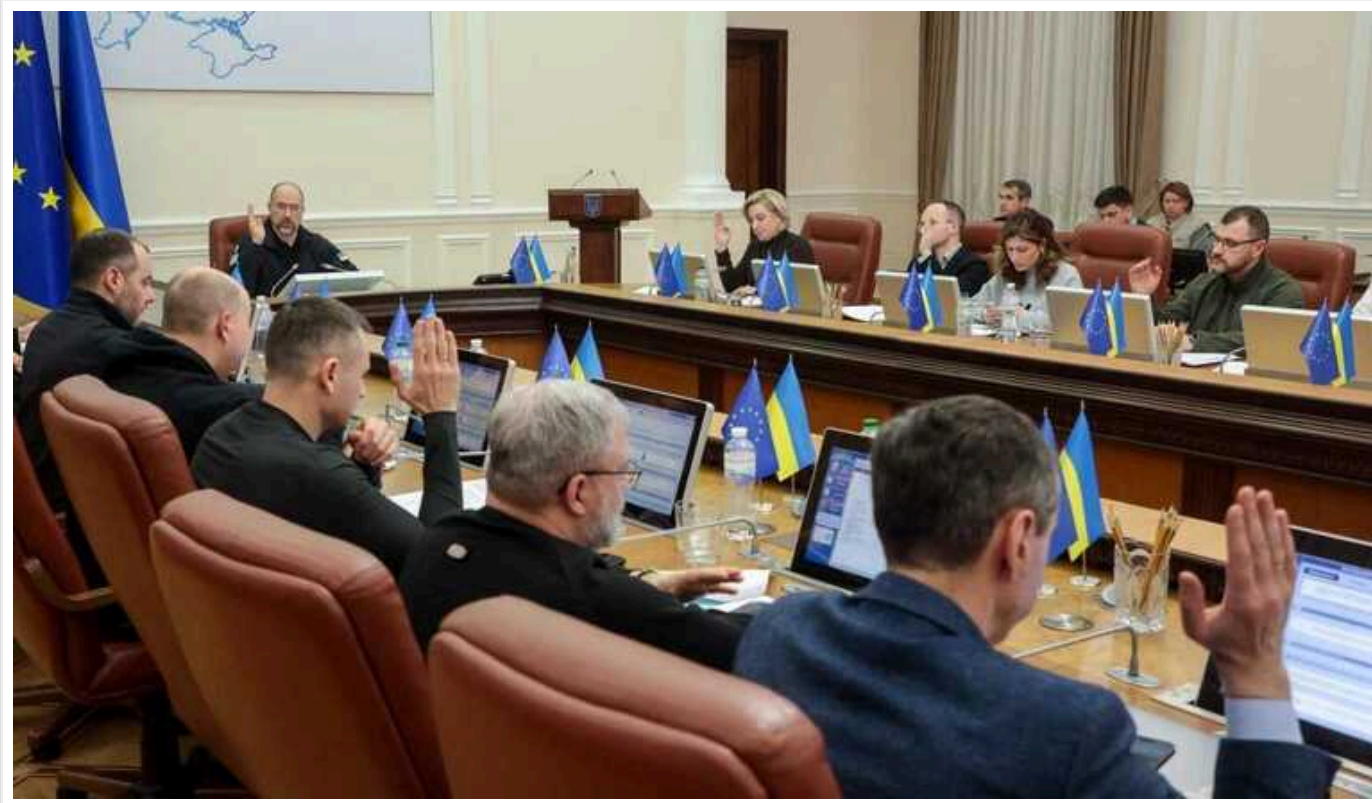
Кабмін виділяє додаткові 9,3 мільярда гривень на програму швидкої відбудови

Кабінет Міністрів України (КМУ) виділив на "швидке відновлення" додаткові 9,3 млрд гривень. Гроші отримають Київщина та ще дюжина регіонів. Кошти, як заявлено, підуть на ремонт житлових будинків, шкіл, лікарень та об'єктів критичної інфраструктури.