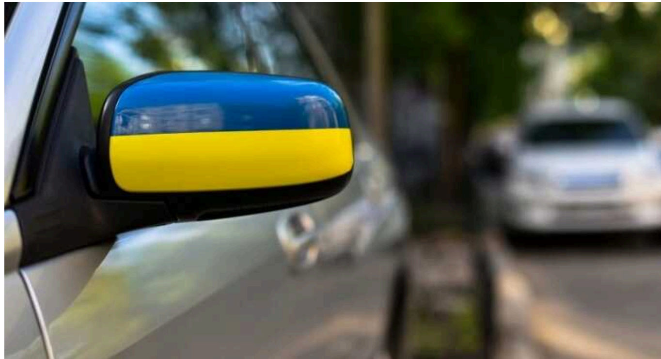
У Німеччині автомобілі на українських номерах мають отримати німецьку реєстрацію

Українці, шукачі захисту від війни, які на машині перебралися до Німеччини понад рік тому, мають до кінця березня одержати німецькі номери.