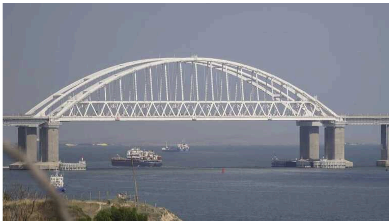
Російська пропаганда пообіцяла «помсту» за Керченський міст: потенційні удари по інфраструктурі Німеччини

Кисельов заявив про можливість нападу на Фемарнзундський і Рюгенський мости.