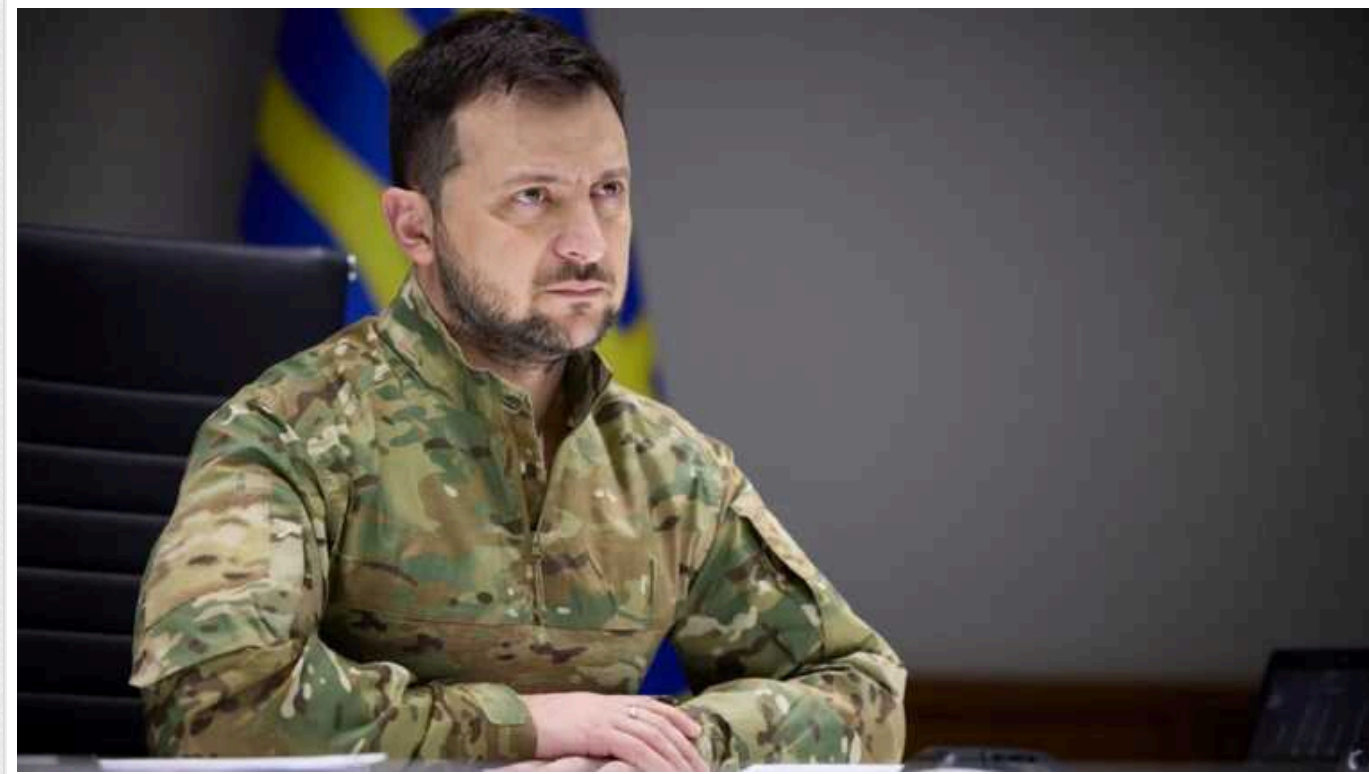
Зеленський назвав умови, за яких реально вигнати російських терористів з моря та неба: "Україна довела, на що здатна"

Україна здатна відновити безпеку та контроль у небі нашої країни та в Чорному морі. Це вже доведено українськими захисниками.