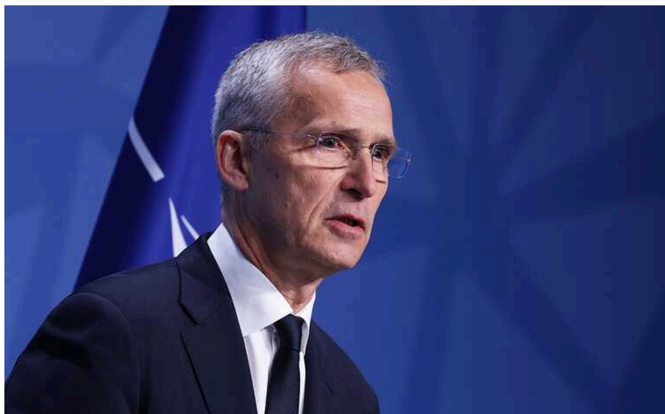
Reuters: Франція запросила генсека НАТО для обговорення допомоги Україні

Франція закликала союзників України 7 березня провести відеодзвінок, щоб обговорити конкретні пропозиції задля посилення підтримки Києва. Запрошення отримали генеральний секретар НАТО Єнс Столтенберг, голова зовнішньополітичного відомства Євросоюзу Жозеп Боррель, а також міністри закордонних справ і міністри оборони низки держав.