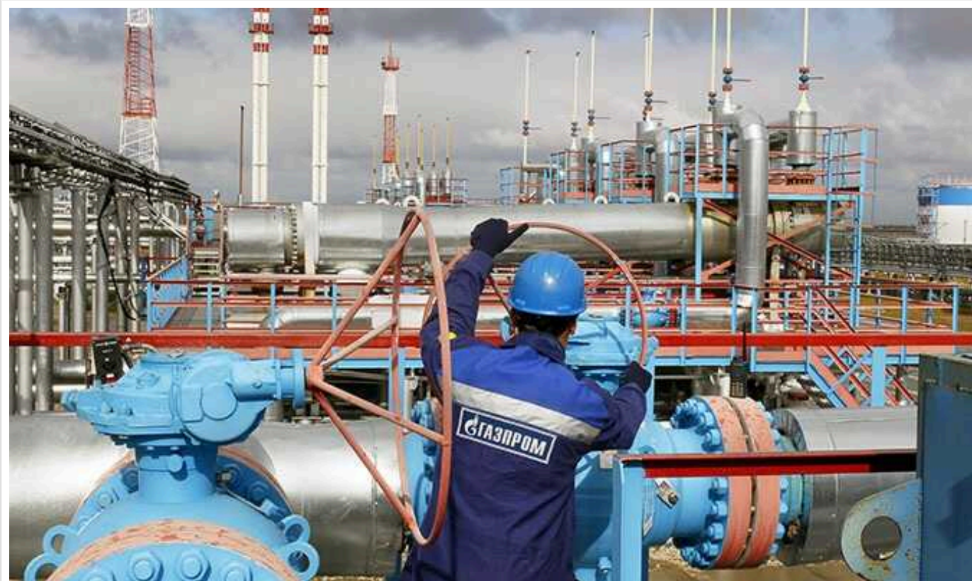
У ЄС розкрили позицію щодо поставок газу з Росії через Україну: транзит зійде на нуль

Європейський Союз (ЄС) не має наміру укладати жодних контрактів із російським "Газпромом", які б дозволили продовжити транзит газу через Україну після 2024 року. Натомість ЄС зосередиться на подальшому зменшенні частки російського газу на своєму ринку. Таким чином, транзит газу з РФ через Україну, найімовірніше, зупиниться з 2025 року, б о Україна також не збирається підписувати договори з "Газпромом".