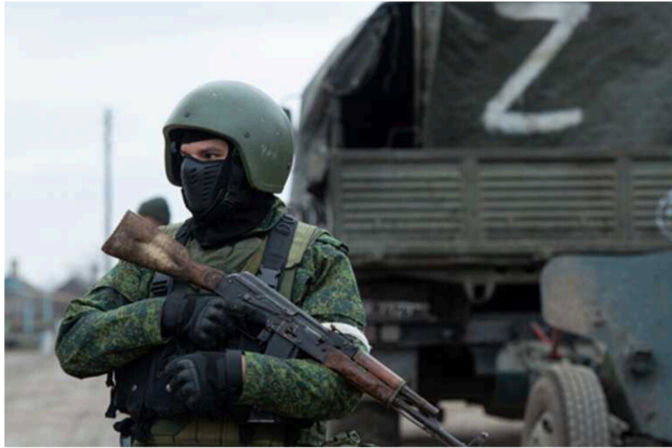
На Лимано-Куп'янському напрямку окупанти деморалізовані і створюють загороджувальні загони, – Синегубов

На Лимано-Куп'янському напрямку російські окупанти деморалізовані та розчаровані. У зв'язку з цим керівництво ворожої армії вирішує створити загороджувальні загони.