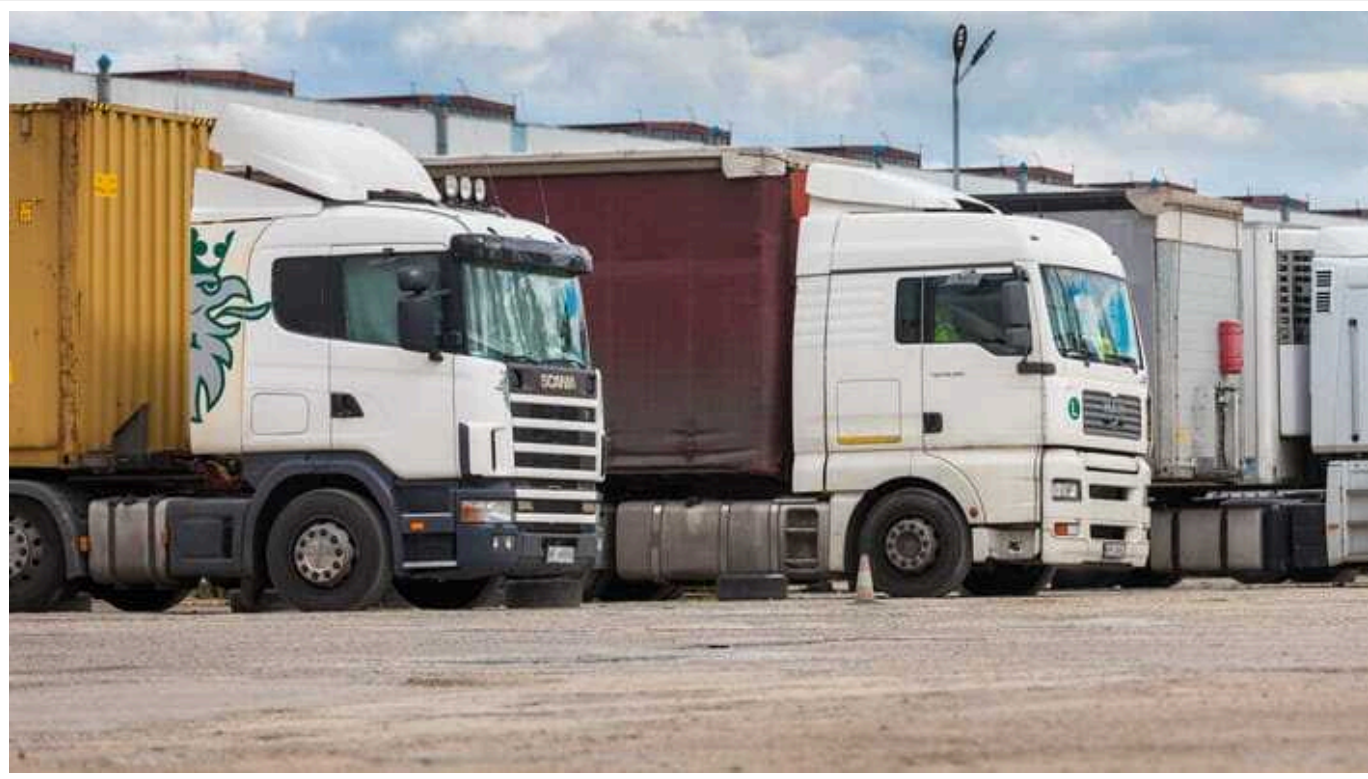
Блокада україно-польського кордону: ЄС готується урізати "транспортний безвіз" з Україною

Європейська комісія (ЄК) офіційно запропонувала внести зміни до правил "транспортного безвізу" з Україною та Молдовою. Йдеться про посилення режиму лібералізації вантажних перевезень. Зокрема, окремим країнам ЄС хочуть дозволити запроваджувати власні обмеження цього режиму.