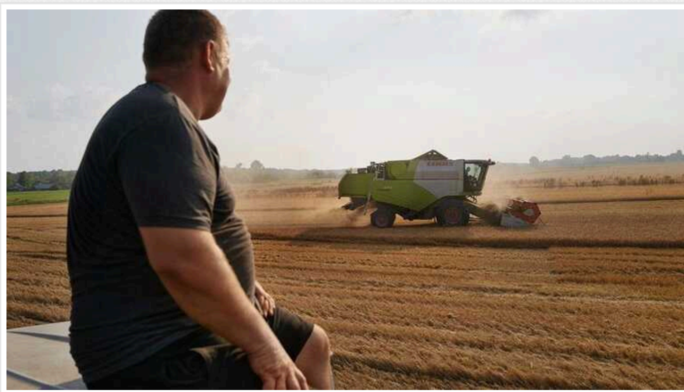
Польські депутати хочуть запровадити повне ембарго на агропродукцію з України, Білорусі та РФ

Запропонована резолюція також передбачає вихід із "Зеленої угоди" та запровадження субсидій для фермерів.