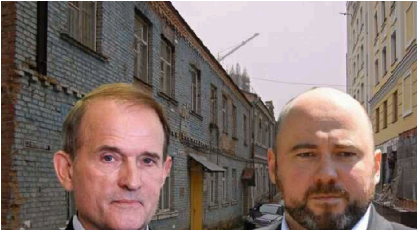
Київрада вирішила земельне питання на користь компанії "Медведчука-Столара"

Столична міськрада поновила договір оренди земельної ділянки в пров. Пилипівському, 4,6,8 для ТОВ "Динамо-Атлантик" ще на 10 років, що дозволить компанії побудувати на вказаній землі офісний центр. Відповідає рішення було прийнято депутатським корпусом попри протести громадськості.