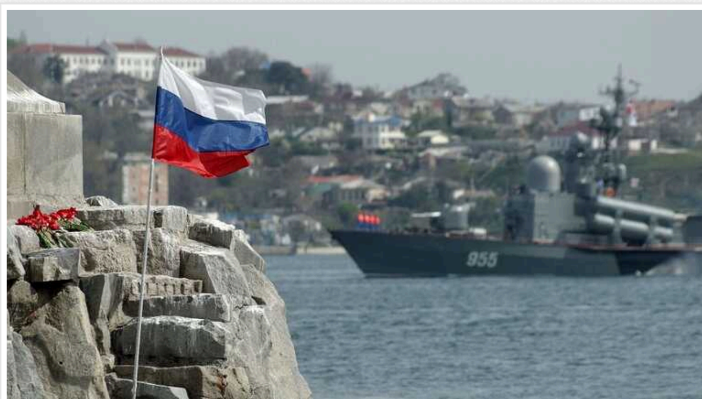
Відбулася третя за масштабністю хвиля обшуків у Криму за 10 років окупації, – КримSOS

5 березня 2024 року окупаційні спецслужби провели обшуки в будинках активістів «Кримської солідарності» та релігійних діячів.