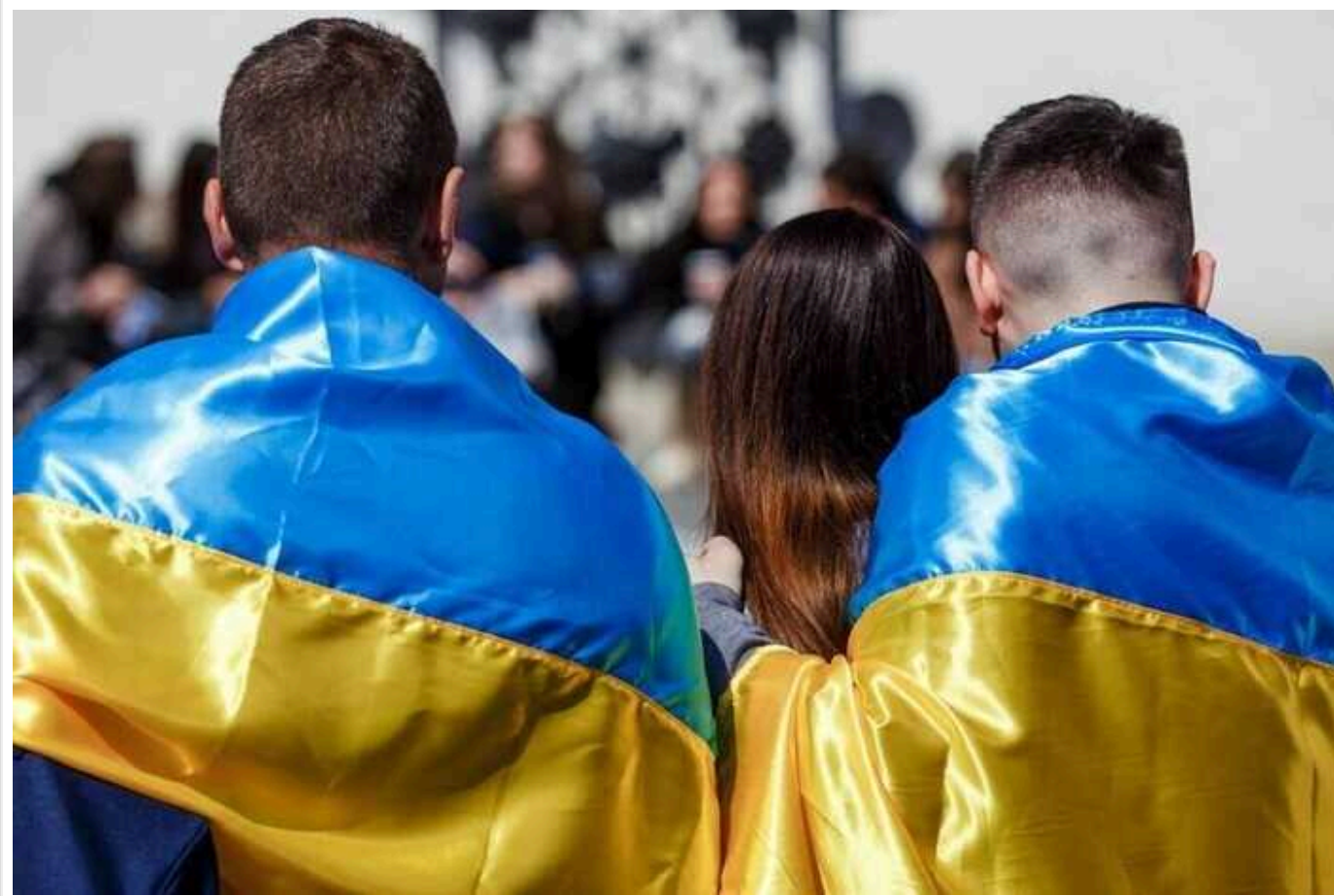
Українці вважають найбільшими помилками влади високий рівень корупції, неналежну підготовку до війни та відставку Залужного, – опитування

Майже 65% громадян України вважають збереження високого рівня корупції та розкрадання бюджету найбільшими помилками чинної влади.