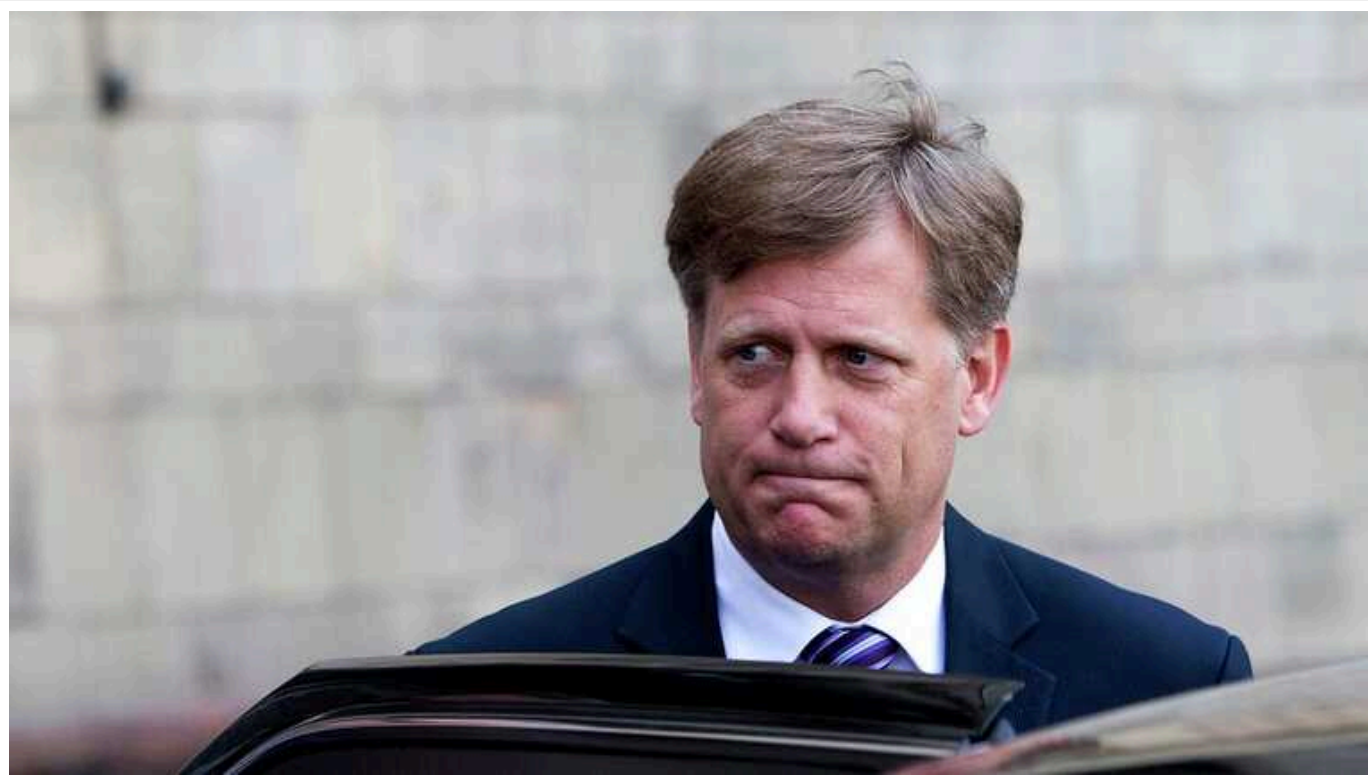
Путін погрожує ядерною зброєю, щоб гальмувати допомогу Україні, він розуміє, що програє, – колишній посол Макфол

Російський диктатор Володимир Путін використовує ядерні погрози для гальмування надання західними державами серйозної військової допомоги Україні. Однак зараз на Заході менше стурбовані ядерним шантажем президента РФ, ніж раніше.