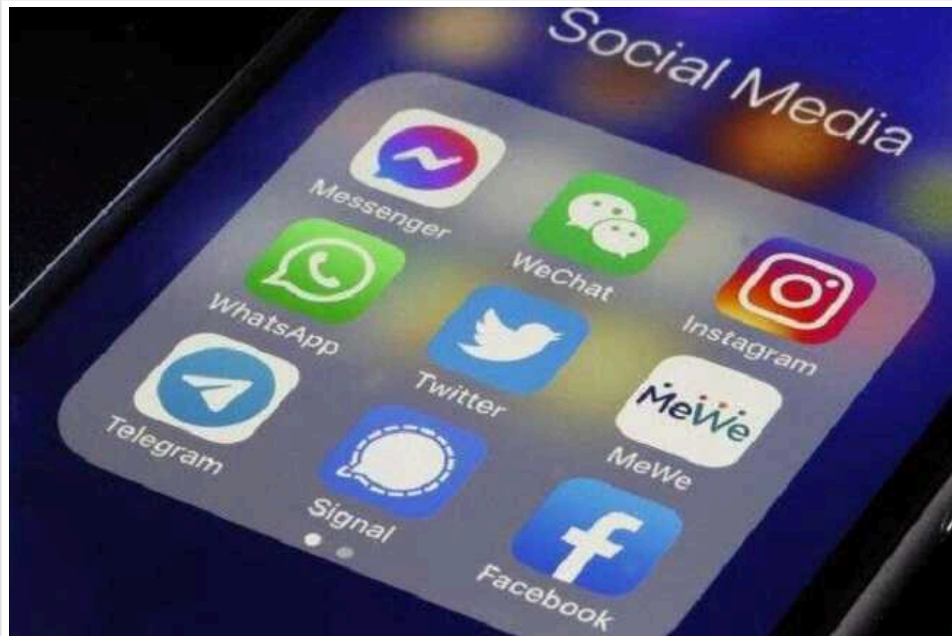
Дуров і Маск відреагували на масштабний збій у Facebook та Instagram

Павло Дуров заявив, що мільйони людей реєструвалися та ділилися контентом у Telegram за останню годину, поки Instagram та Facebook не працювали.