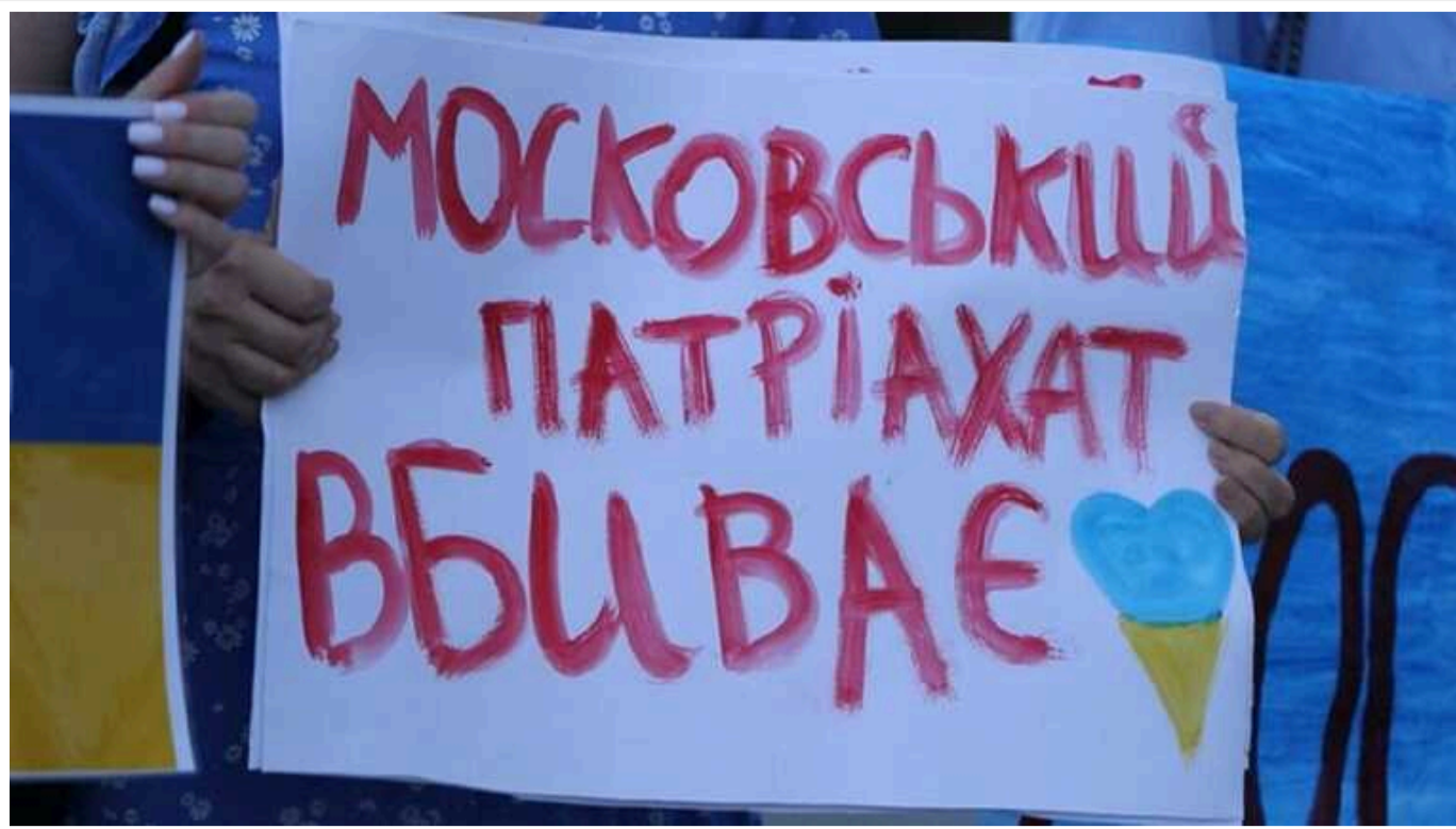
У ВР підтримали законопроект про заборону УПЦ МП в Україні

Комітет Верховної Ради з питань гуманітарної та інформаційної політики підтримав проєкт закону №8371 щодо заборони Української православної церкви Московського патріархату. Нардепам рекомендували підтримати закон у другому читанні та в цілому.