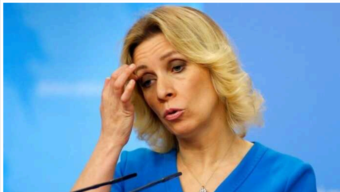
Захарова вигадала "націоналістичну ідеологію" проти Росії в МОК

Офіційна представниця Міністерства закордонних справ Росії Марія Захарова лицемірно звинуватила Міжнародний олімпійський комітет (МОК) у прояві дискримінації до представників РФ за національною ознакою. Поплічниця режиму Володимира Путіна, який хоче знищити Україну та заперечує її існування, назвала несправедливим відсторонення атлетів країни-агресорки від світових змагань.