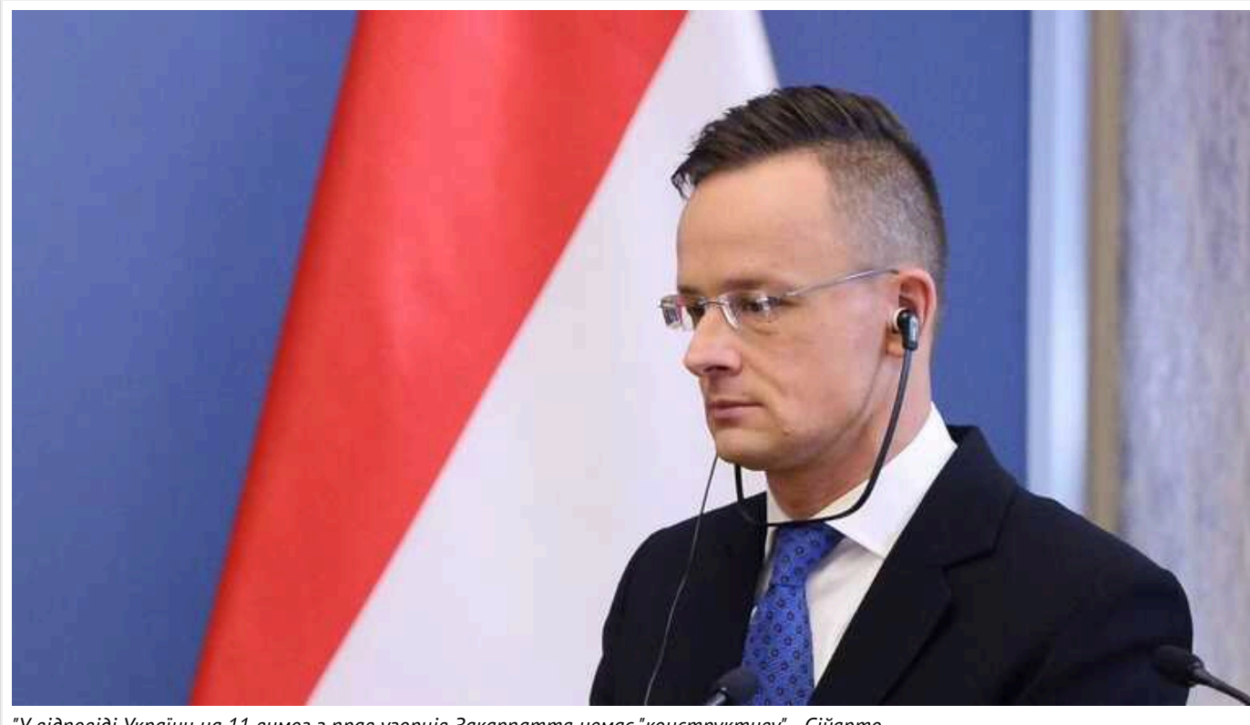
"У відповіді України на 11 вимог з прав угорців Закарпаття немає "конструктиву", - Сіярто

Міністр закордонних справ Угорщини Петер Сіярто заявив, що у відповіді України на їхні 11 вимог щодо прав угорців Закарпаття немає "конструктиву", тому зустріч Зеленського та Орбана поки неможлива.