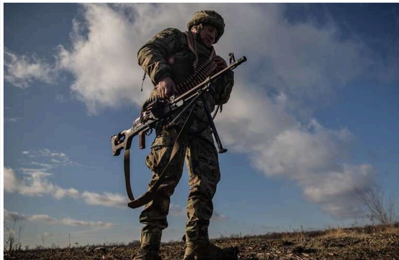
Втрати ворога: мінус 950 окупантів та понад 2100 одиниць техніки за добу

Сили оборони України за минулу добу зменшили чисельність російської окупаційної армії на 950 загарбників. Загальні бойові втрати Росії у живій силі становлять 1 млн 354 тис. 810 осіб.