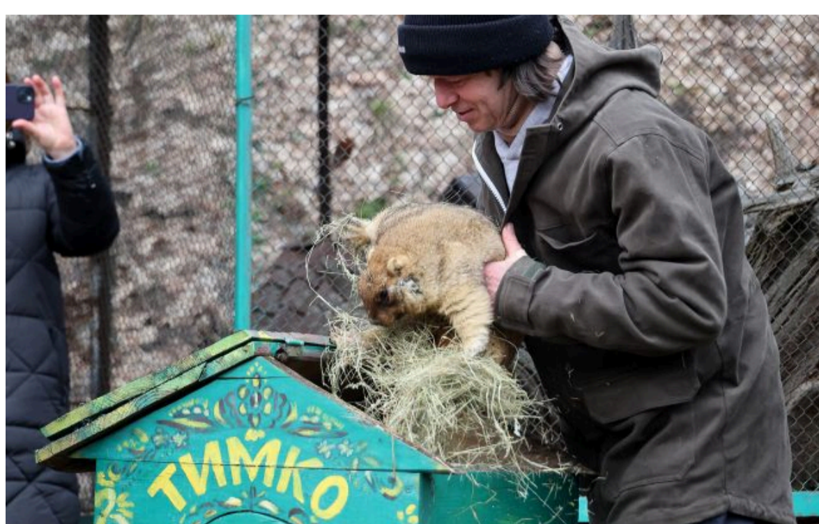
День бабака - щорічна традиція в Україні та світі