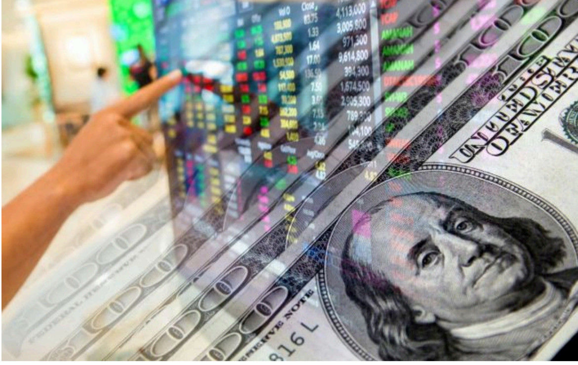
Фото: що чекати від курсу валют до кінця травня