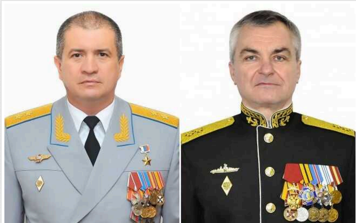
Суд Гааги видав ордери на арешт командувачів дальньої авіації та Чорноморського флоту РФ

Суд Гааги сьогодні, 5 березня, видав ордери на арешт командувача дальньої авіації РФ Сергія Кобилаша і командувача Чорноморського флоту РФ Віктора Соколова.