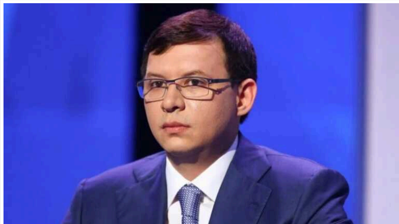
Екснардепу Мураєву загрожує до 15 років тюрми з конфіскацією майна: до суду скерували справу про підривну діяльність

СБУ повідомляє, що екснардепу Мураєву загрожує до 15 років тюрми з конфіскацією майна.