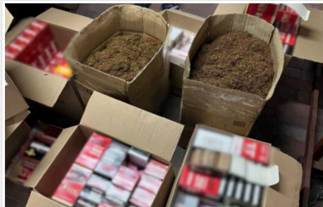
Київська поліція в Переяславі ліквідувала кустарне виробництво цигарок

На Київщині правоохоронці викрили налагоджене підпільне виробництво підкацизної продукції, яку 54-річний організатор збував без дозвілних документів. Орієнтована вартість вилучених цигарок становить майже 530 тисяч гривень.