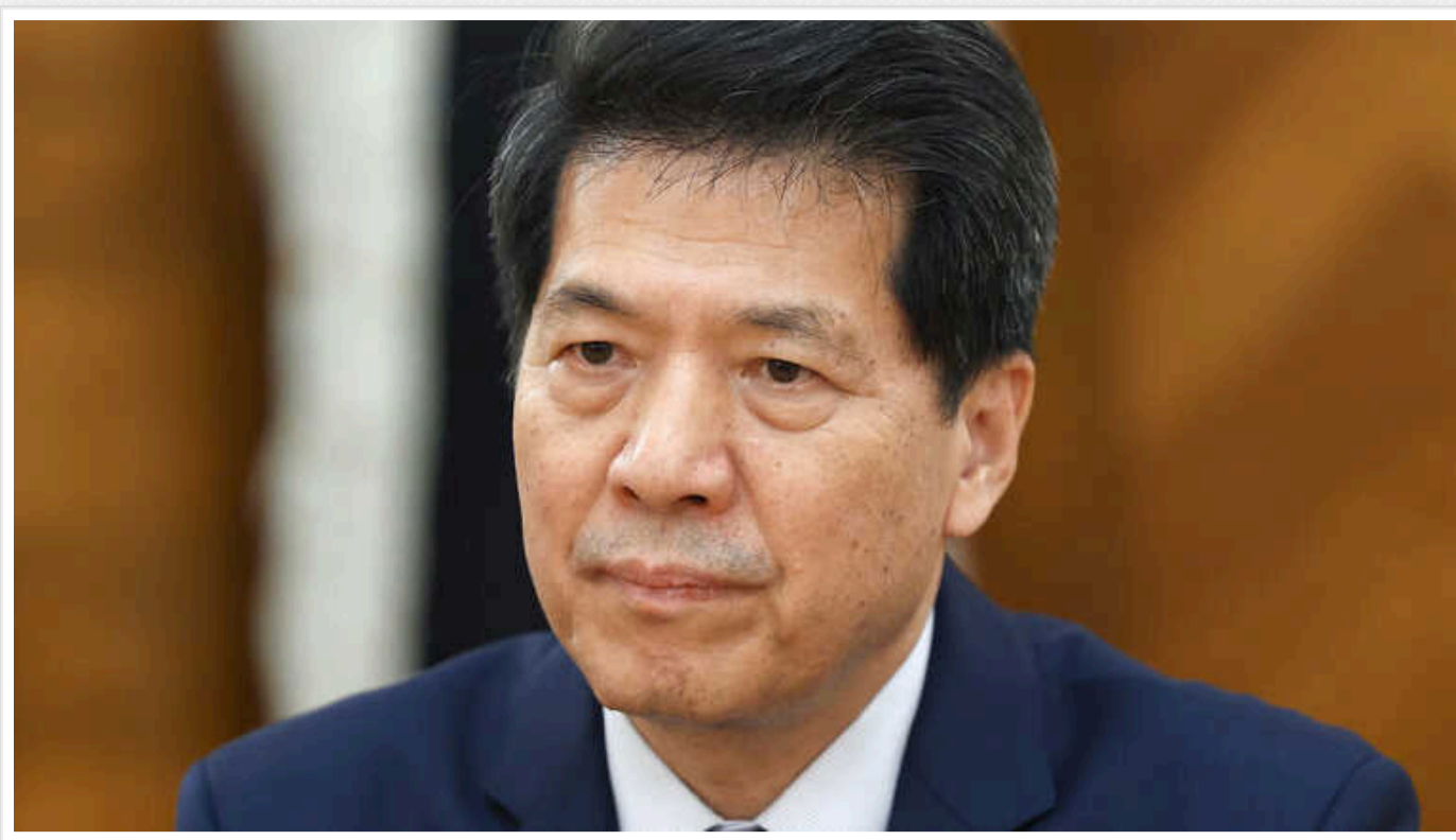
Китайський спецпредставник по Україні вже відвідав Брюссель та Москву

Йому поставили завдання "прозондувати ґрунт" щодо перспективи мирних переговорів.