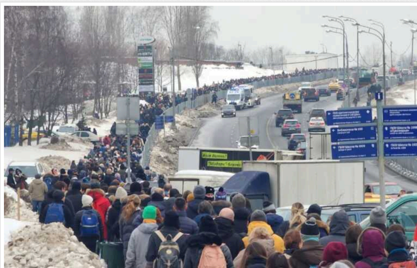
У РФ почалися затримання учасників прощання з Навальним

У Росії силовики почали затримувати людей, які приходили на прощання з загиблим опозиціонером Олексієм Навальним. Їх вираховують за камерами відеонагляду – система розпізнавання обличчя в Москві "дає можливість простежити шлях кожної людини аж до її під'їзду".