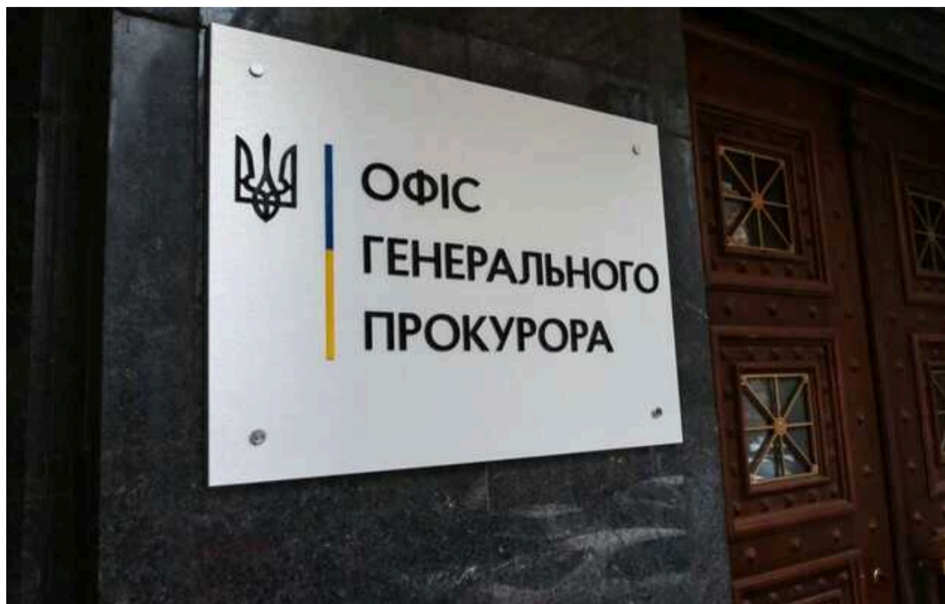
Правоохоронці повідомили про підозру двом російським окупантам, які розстріляли у Бучі мирного жителя

Правоохоронці повідомили про підозру двом російським окупантам, які розстріляли мирного мешканця Бучі Київської області. Чоловік намагався потрапити до батьківського дому, але йому відмовили – він повернувся та пішов назад, а ворог відкрив вогонь.