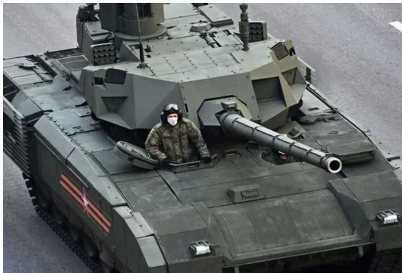
Британська розвідка пояснила, чому Росія не застосовує танк "Армата" у війні проти України, і пригадала ганьбу з "чудо-технікою"

Росія відмовилася направляти на фронт в Україні свої новітні танки "Армата". Причиною цього стало побоювання репутаційного збитку від втрат цієї техніки, а також через їхню недостатню кількість.