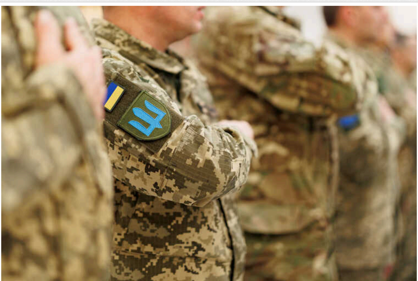
Мобілізація в Україні: Хто може отримати відстрочку та які для цього потрібні документи

В Україні з початку повномасштабної війни триває загальна мобілізація, під час якої військовозобов'язаних громадян призивають на службу. Проте ціла низка категорій українців можуть отримати відстрочку від мобілізації.