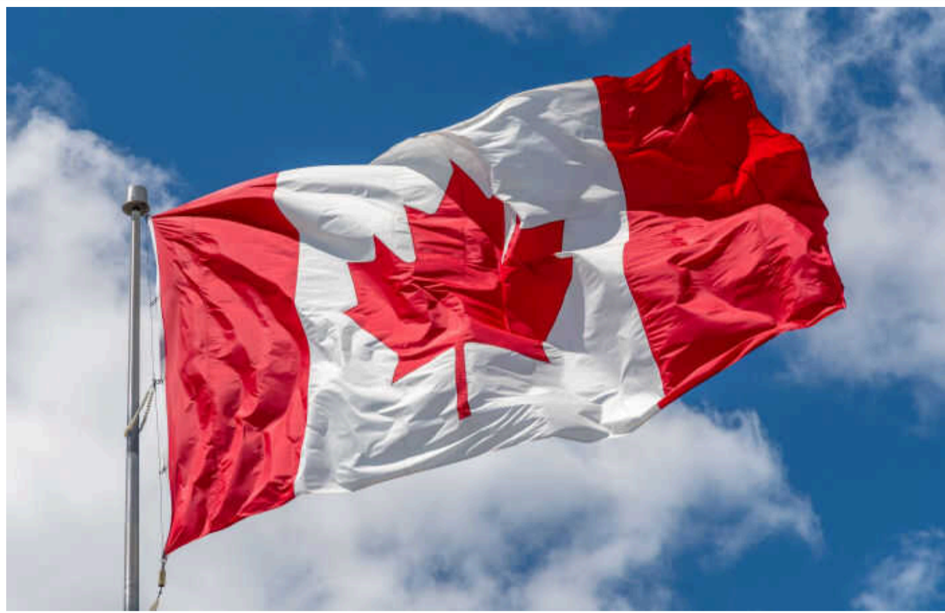
Канада найближчими днями прийме рішення щодо передачі ракет CRV7 Україні