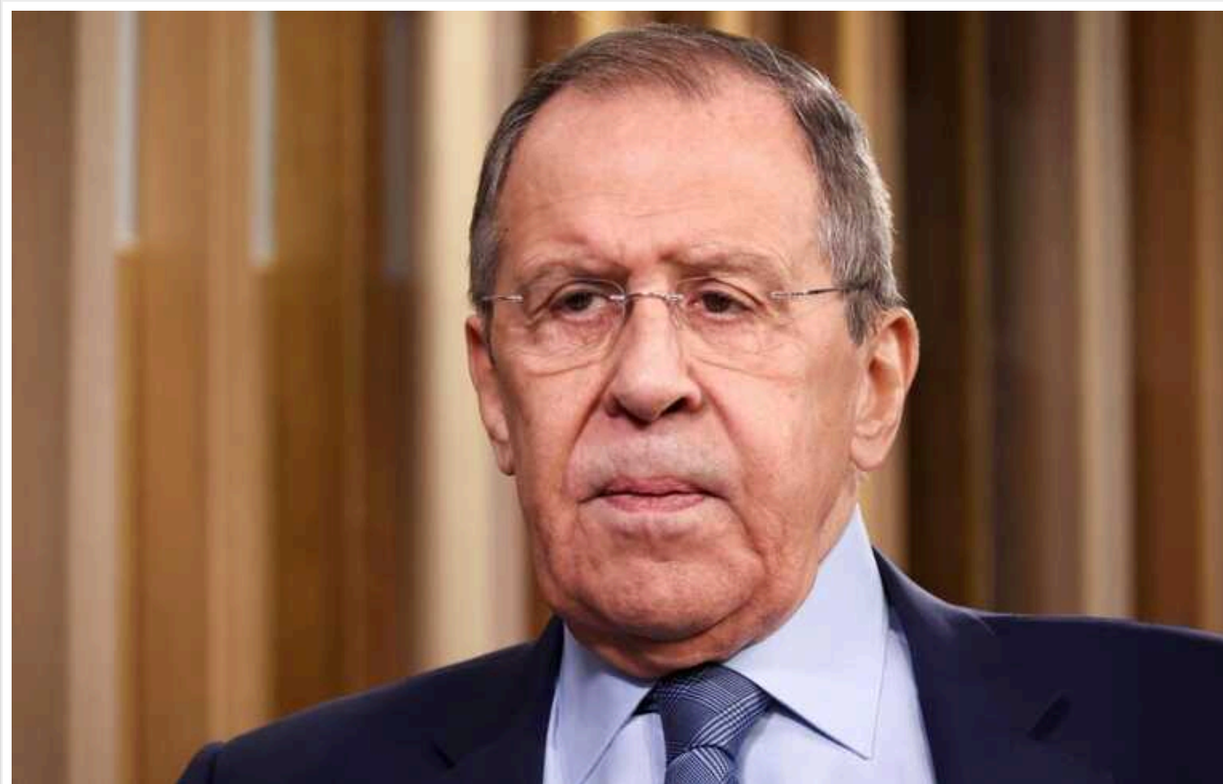
Посли ЄС відмовилися від зустрічі з главою МЗС РФ Лавровим

Посли країн Європейського Союзу у Москві відмовилися від запропонованої зустрічі з міністром закордонних справ Росії Сергієм Лавровим. У представництві Євросоюзу зазначили, що відмова була викликана низьким рівнем довіри до російського МЗС.