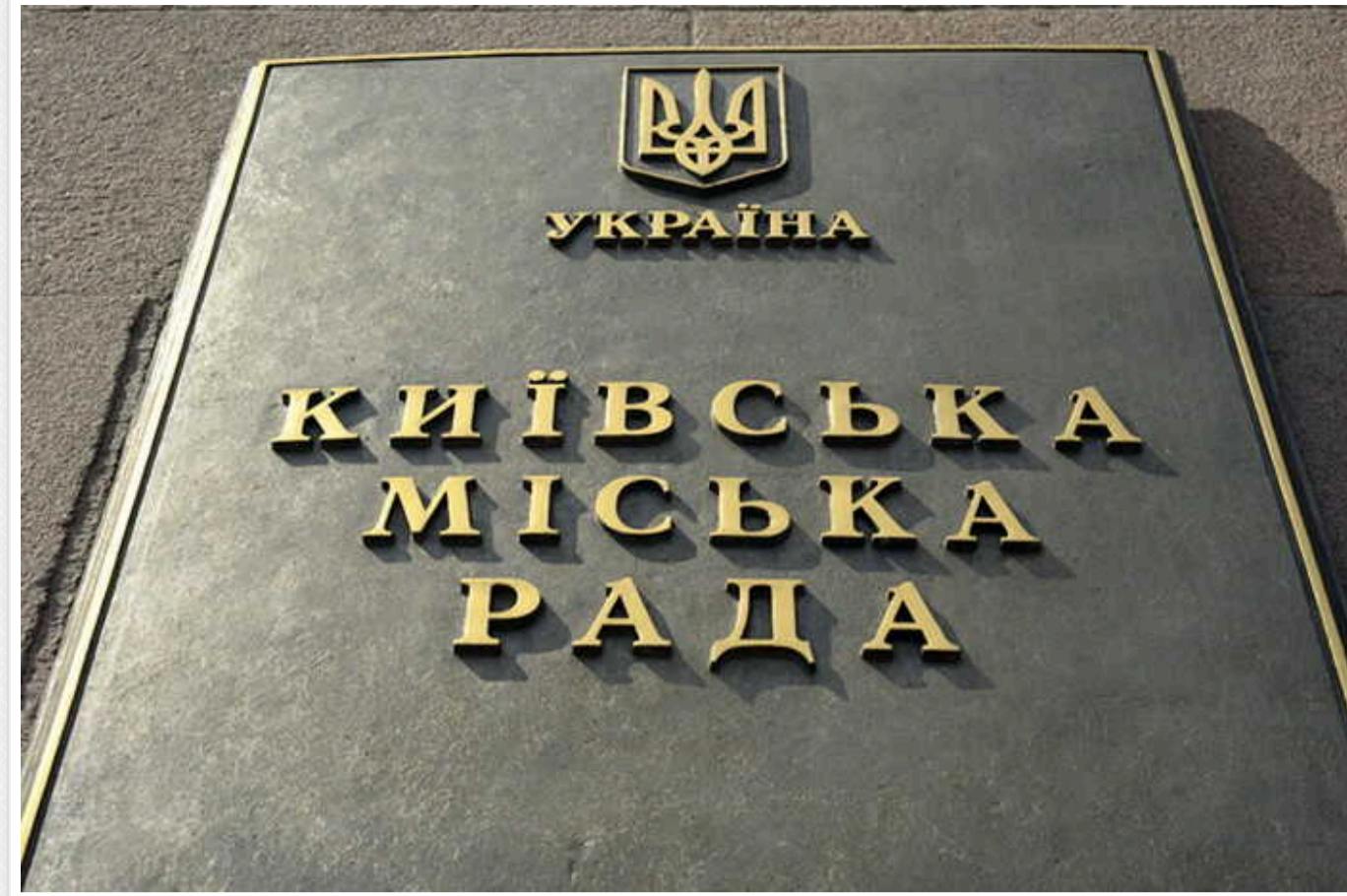
У Київській міській раді віддали ще півмільярда на обладнання для керування освітленням Києва

КП «Інформатика» Київської міської ради за результатами тендеру замовило ДП «Хідден» ТОВ «Хідден Енерджі» обладнання для керування зовнішнім освітленням Києва на 448,43 млн грн. Ціна в доларовому еквіваленті не змінилася з літа.