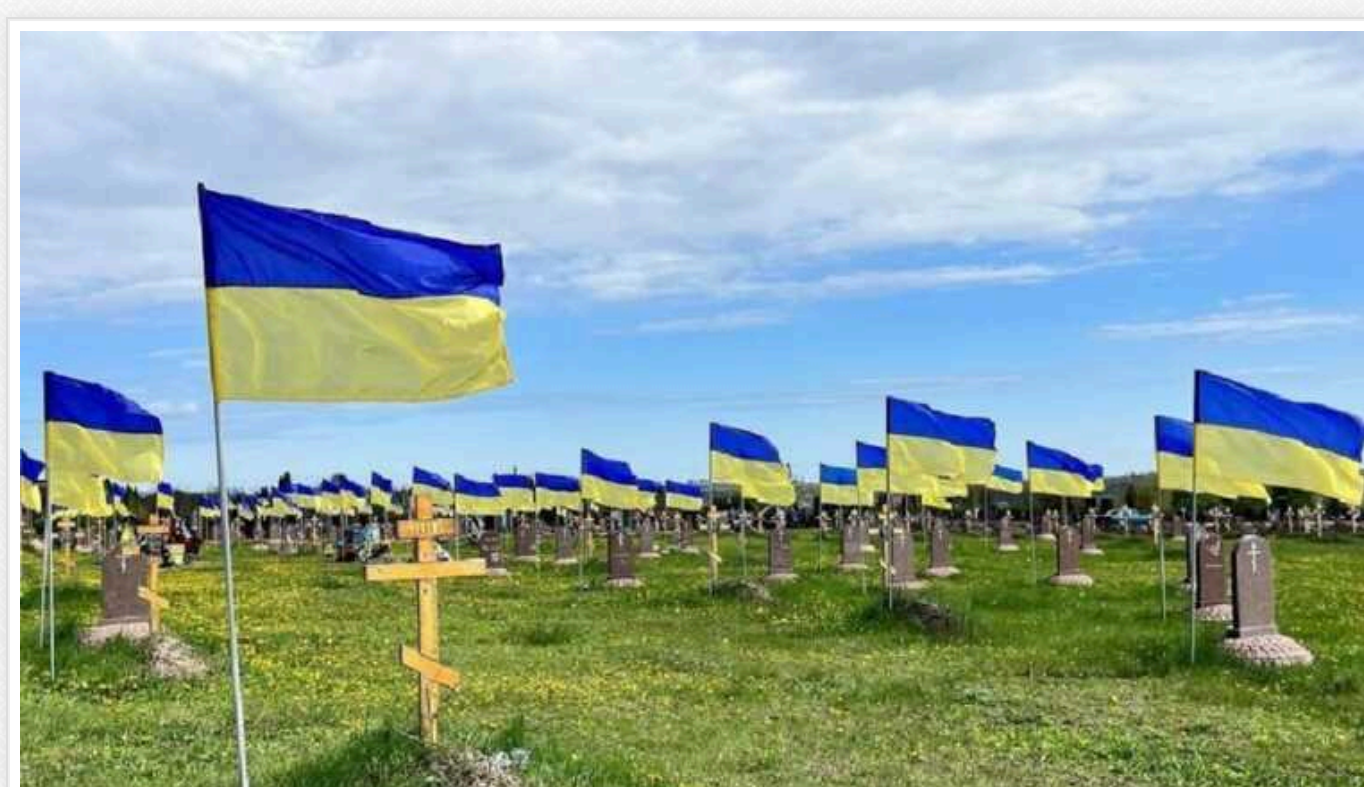
У Дніпрі вандалі понівечили могили українського військового: порізали прапор і поламали хрест

У Дніпрі невідомі вандалі осквернили могили військового, який загинув, борючись за Україну з російськими окупантами. Металевий флашток хтось погнув, прапор із зображенням воїна – порізав, а поряд залишив листівку із клоуном.