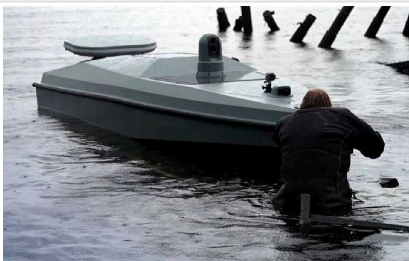
Скільки російських кораблів вже потопив український морський дрон Magura V5

Цієї ночі надводні дрони Magura V5 змогли відправити на дно черговий російський корабель. Цього разу – це "Сергій Котов". І це не далеко не єдина успішно уражена ціль із застосуванням цих безпілотників. На рахунку "Магури" російський ВДК, патрульні та ракетні катери тощо.